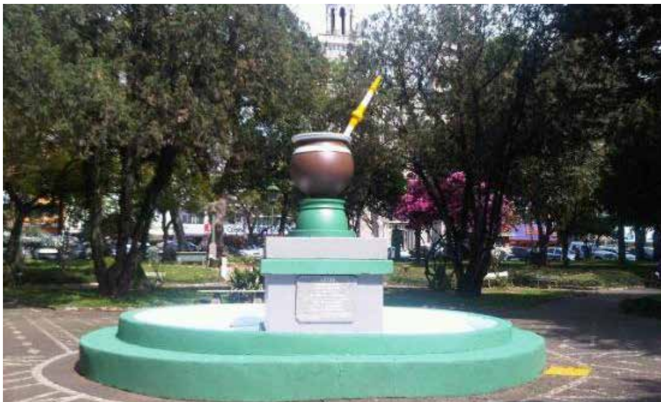
Praça Marechal Floriano, em Passo Fundo (RS)