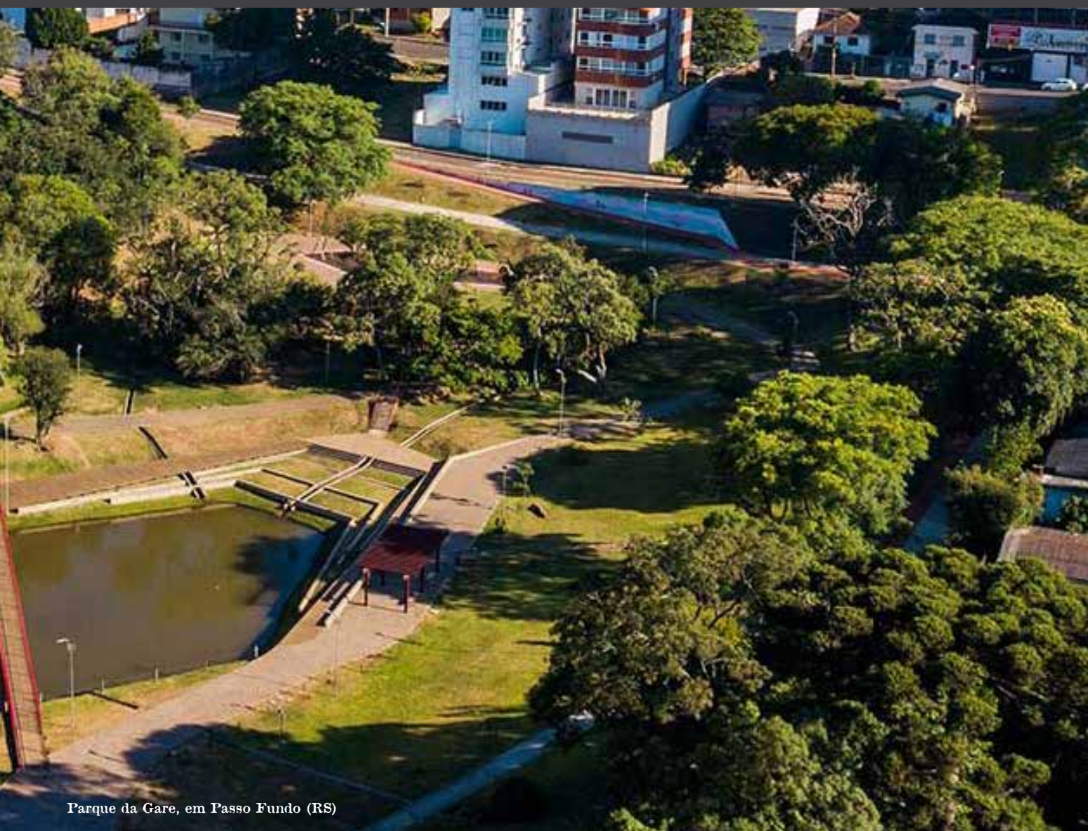
Parque da Gare, em Passo Fundo (RS)

Local – ESL, principalmente para que os grupos da região tivessem maior acesso à literatura da Irmandade. Sendo assim, em fevereiro de 2002 foi implantado o ESL/ISAA/NORTE-RS com sede na cidade de Passo Fundo.