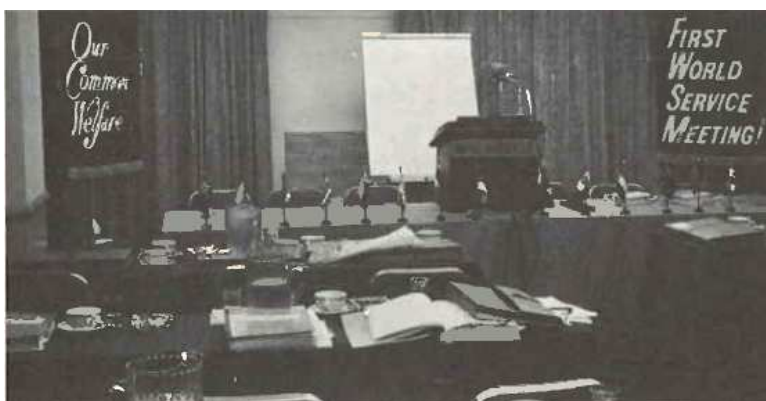
Primeira Reunião de Serviço Mundial